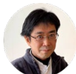
篠沢 健太 工学院大学教授